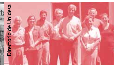
Directorio de Unidesa